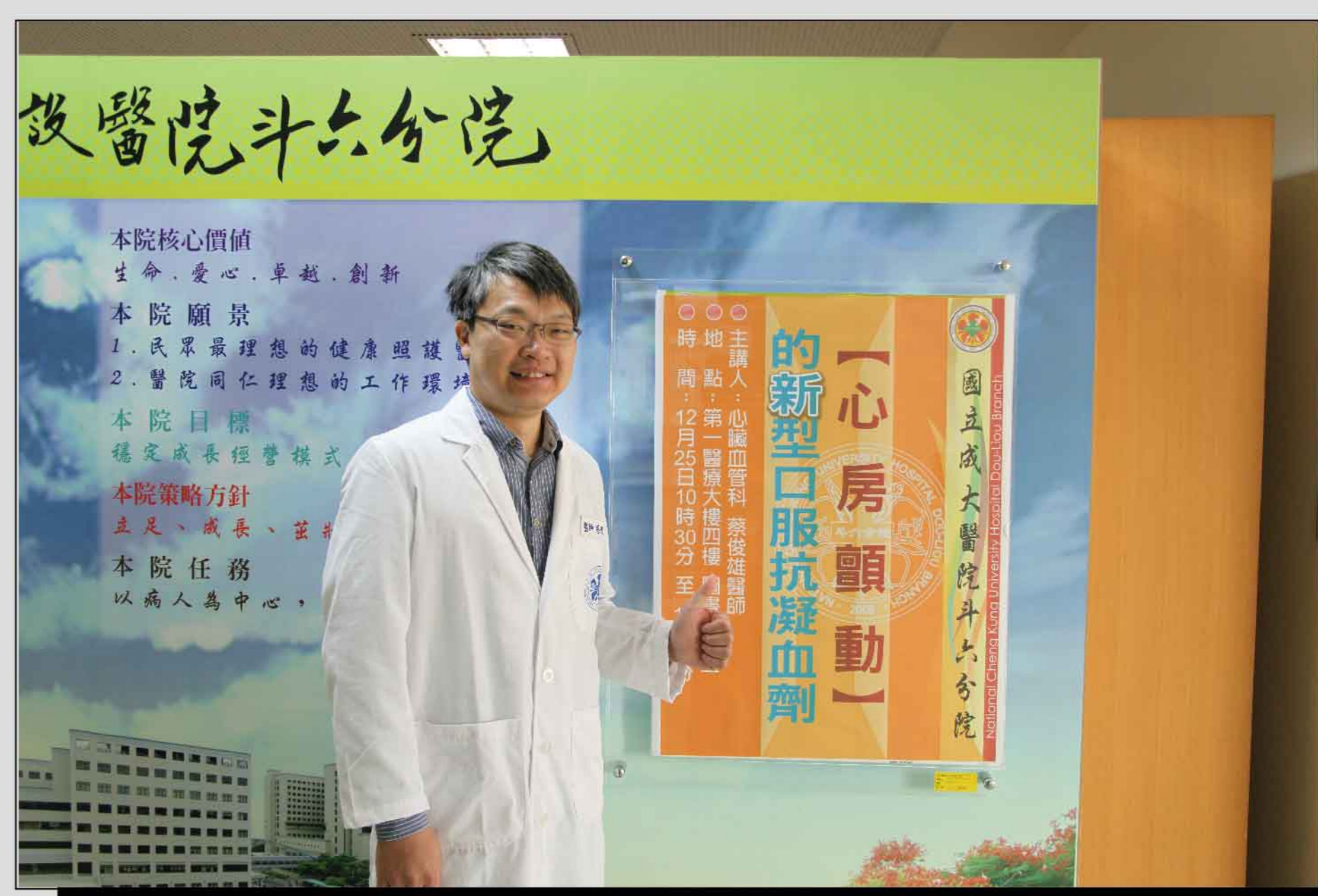
發表人：心臟血管科/蔡俊雄醫師

※（本篇內容旨在提供一般醫療衛教知識，如有不適或疾病，應尋求專科醫師的診治，以免貽誤病情，並能獲最佳治療的效果。）